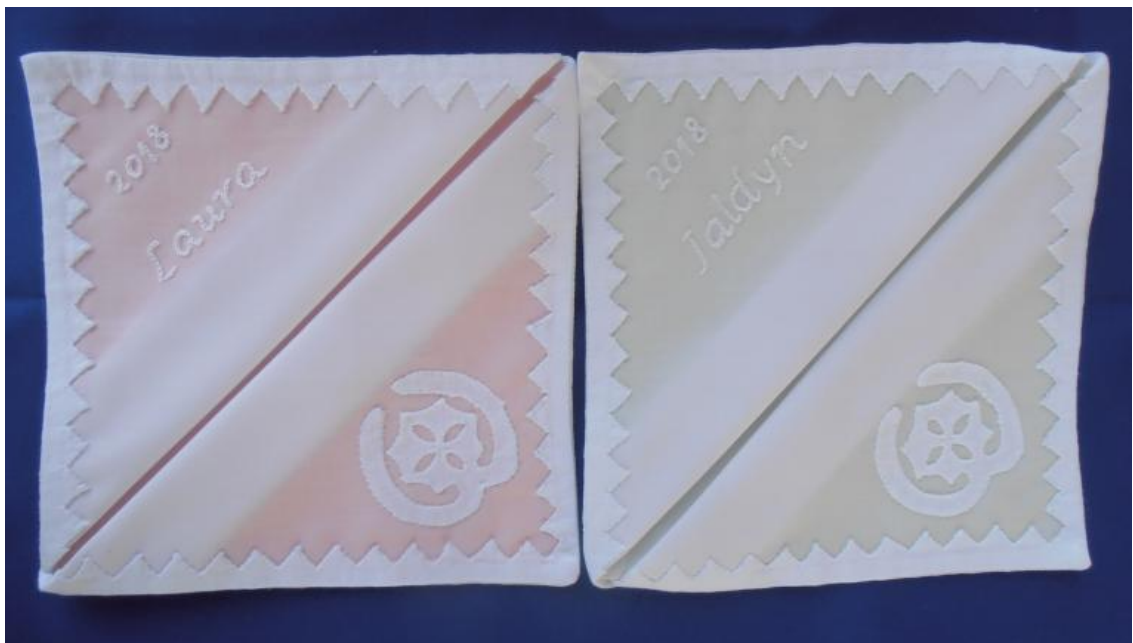
9. számú melléklet: Az ajándék keresztelői kendők