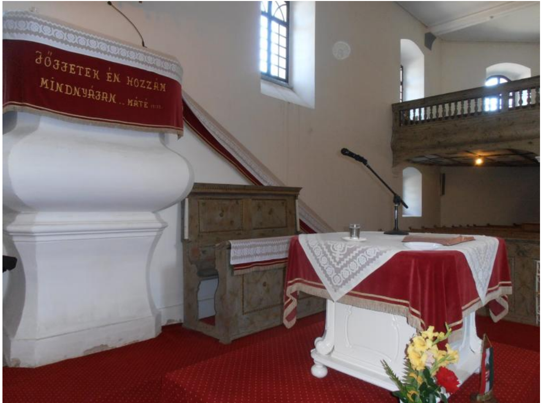
8.számú melléklet: A szószék, Úr asztala az új garnitúrával