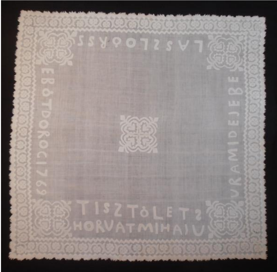
1.sz. melléklet: A nagydorogi 1769-ből származó Úr asztala terítő