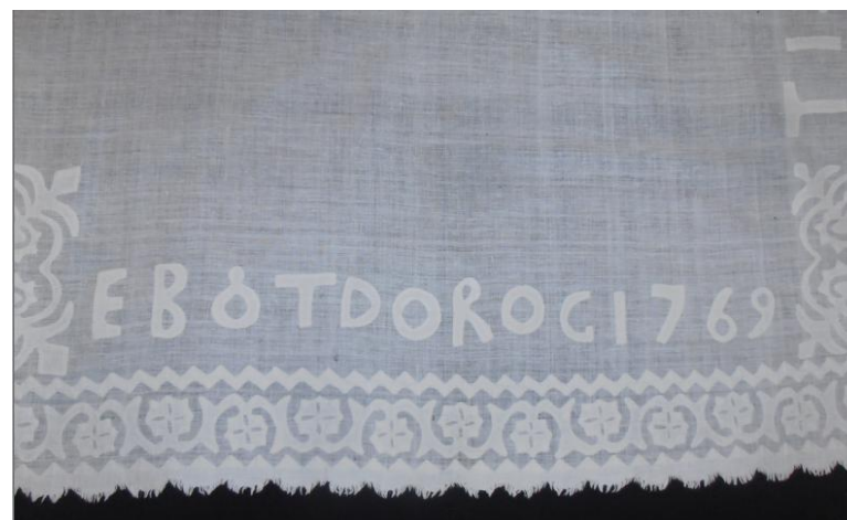
2-5. számú mellékletek: Az úr asztala terítőjének négy oldala