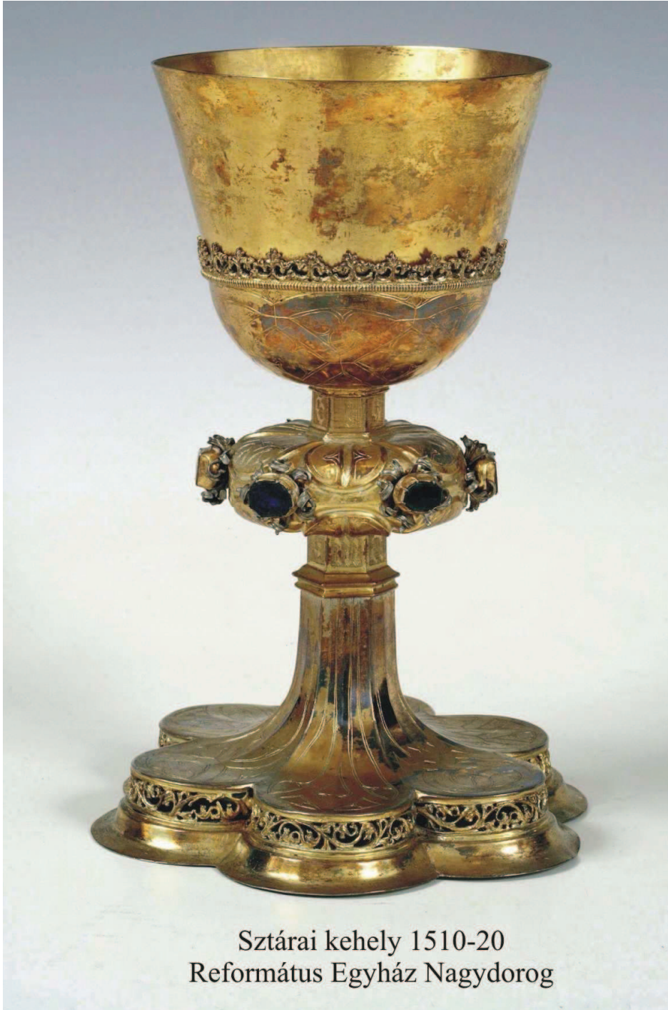
Sztárai kehely 1510-20 Református Egyház Nagydorog