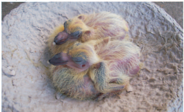
Ötnapos korban 2db 222g