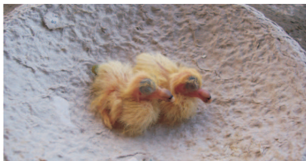
Egynapos fiókák 2db 34g