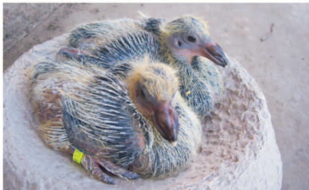
Tiznapos korban 2db 672g