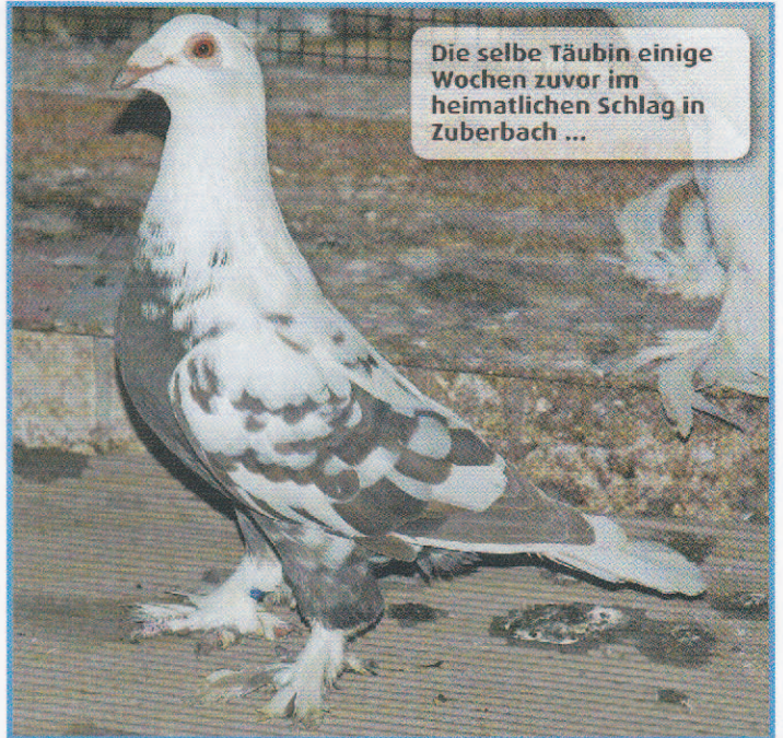
Die selbe Täubin einige Wochen zuvor im heimatlichen Schlag in Zuberbach ...

Bewertung: Kopf - Augen - Rand - Form - Federstruktur - Schnabel - Farbe - Glanz. A.B.