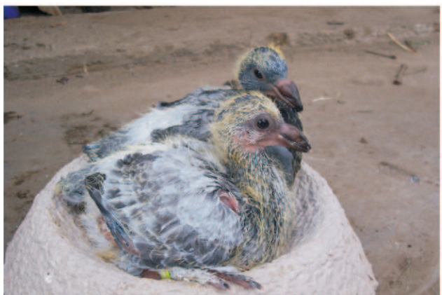
Tizenöt napos korban 2db 952g