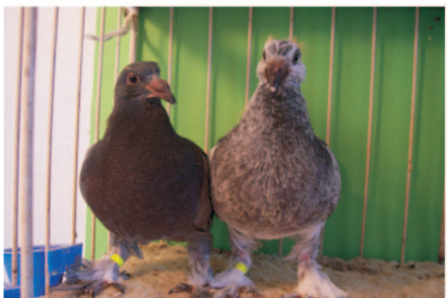
Húszöt napos korban 2db 1231g Harmincöt napos korban 2db 1428g