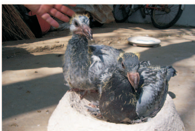
Húsznapos korban 2db 1204g