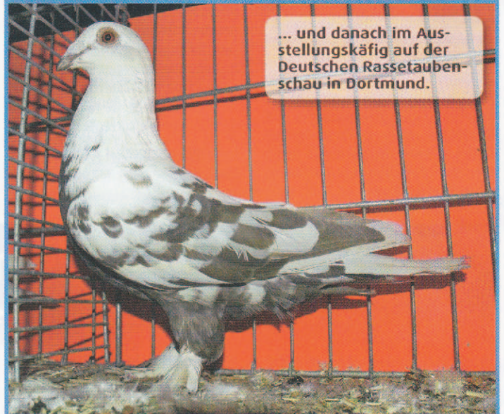
... und danach im Aus-stellungskäfig auf der Deutschen Rassetauben-schau in Dortmund.