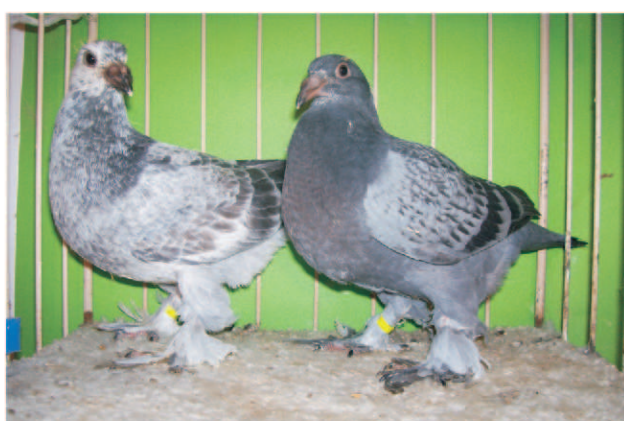
Hamincnapos 2db 1326g